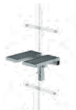
Abb. Bestell-Nr. 77539